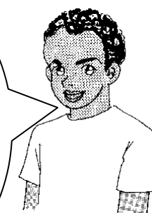
2-ой участник разговора

Нет, нельзя. Для этой истории важен именно камень.